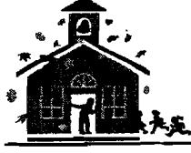
په ښوونځي کښې