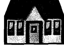
په کور کښې